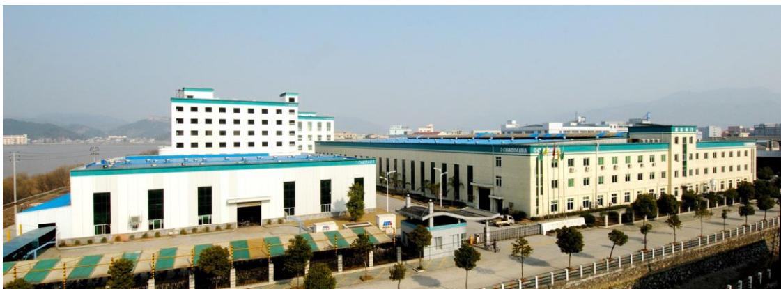
图1 公司高新技术园区

超达阀门集团股份有限公司（以下简称“超达”、“超达公司”或“公司”，下同）始创于1984年，座落于永嘉县瓯北镇，是一家以高、中、低压阀门生产为主导，集研发、制造、销售、服务等功能于一体的现代化企业，是国内通用设备制造业产销量最大的领军企业之一。公司综合实力位居温州市领军企业、温州市百佳工业企业、温州市百佳诚信企业、温州市质量立市功勋企业、永嘉县功勋企业。其规模和经济效益位居行业前列，2017年销售额达到4.5亿元。公司建立了重点企业研究院、省级企业技术中心、浙江省博士后工作站、温州系统流程装备科学研究院，参与国家标准及行业标准起草91项，2项浙江制造标准，其中JB/T 8937-1999《对夹式止回阀》是中国大陆民营企业起草的第一项阀门标准，拥有154项国家专利（其中发明专利34项），荣获3项国家重点新产品、5项国家火炬计划项目证书、6项省级新产品、14项浙江省科技成果登记、6项中国机械工业科学技术奖、52项省市县等科学技术奖。先后荣获高新技术企业、浙江省名牌产品、浙江出口名牌、浙江省著名商标、省纳税“AAA”级信用等级、信用“AAA”级、温州市专利示范企业、温州市百家诚信企业、安全生产标准化三级企业等荣誉。公司建立了严格的质量管理和保证体系，并持续改进完善，先后通过了ISO9001、ISO14001、OHSAS18001、API6D、CE/PED、API607、API6FA、ISO15848-1和TS等体系和产品认证，并在国内首家通过API600闸阀认证。